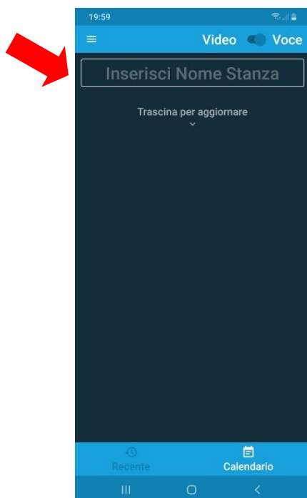
Figura 1. Schermata visualizzata all'avvio dell'App Jitsi